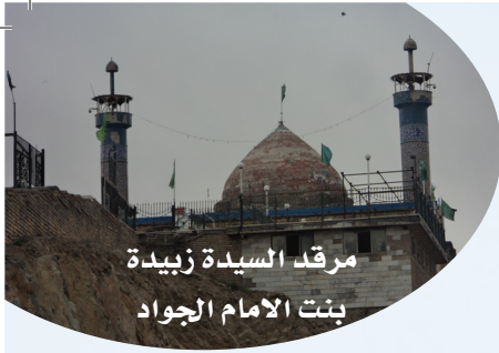
مرقد السيدة زبيدة بنت الامام الجواد